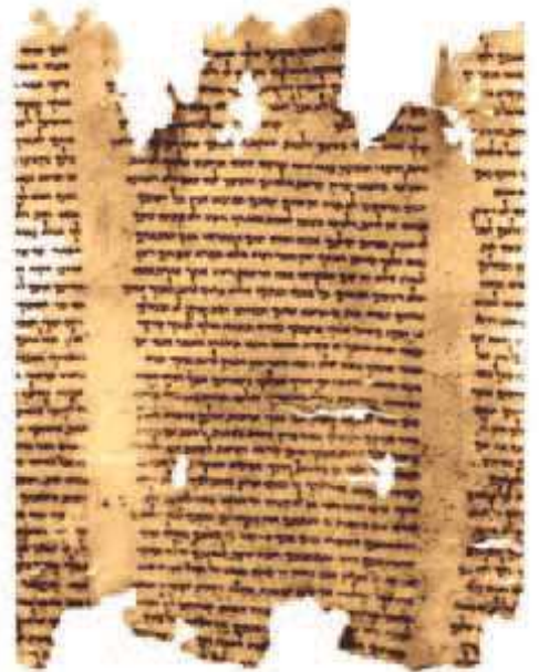
Qumranin tekstilöytöjä, osa Jesajan kirjasta

malana, hän väistämättä joutuu eroon Isästä. Näin kävi Paavalillekin tämän opetuksen mukaan. Juutalaisella katsotaan olevan suora suhde Jumalaan Siinain liiton kautta. Jeesuskin oli yhteydessä Isään vain tämän liiton kautta, ei muuten.